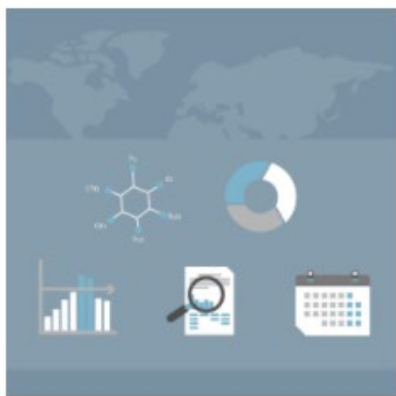
Module 4 - Data Standardisation