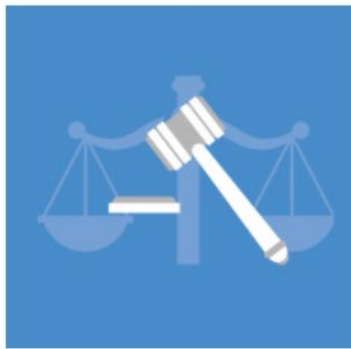
Module 2 - Legal Implementation