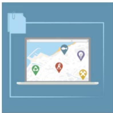
Module 5 - Online Reporting Systems