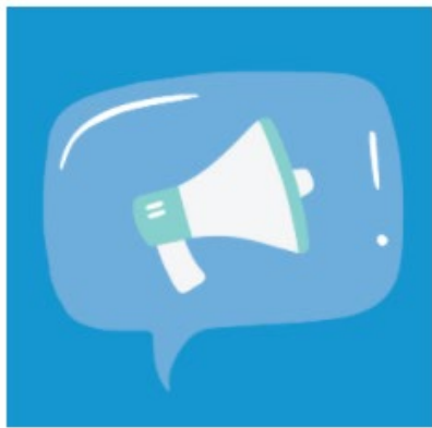
Module 1 - Communication & Dissemination of Data